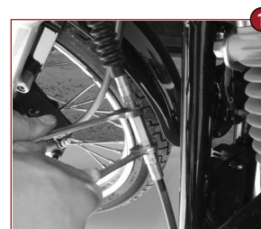
Bowdenzug entspannen Relax clutch cable

Ein Montagevideo finden Sie auf https://videos.m-motorcycle.de/de/einbauanleitungen/120-30