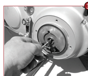
Kupplungsmutter entfernen Remove clutch locknut