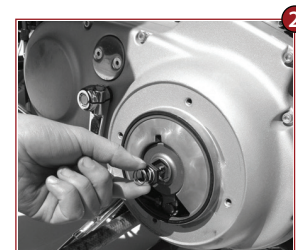
Sicherung entfernen Remove clutch locknut